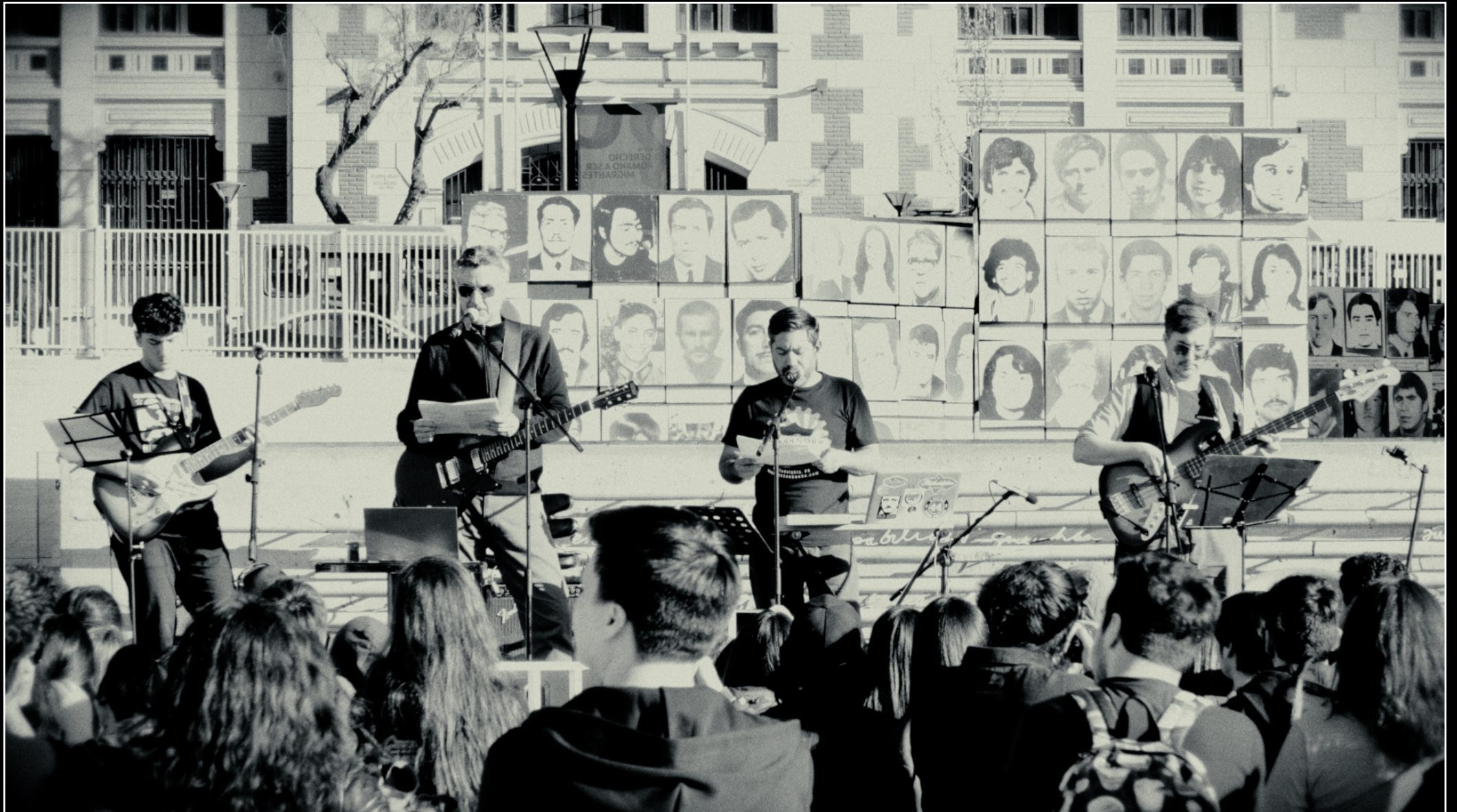
Radio Magallanes en el Museo de la Memoria y los Derechos Humanos. Santiago de Chile, 11 de septiembre de 2019.

Registro de video disponible en este link.